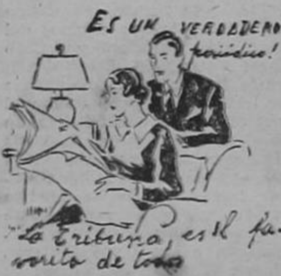
ES UN VERDADERO periódico! La tribuna, es el favorito de todos

fluctuantes. El precio para cafés en existencia se mantuvo firme, pero las ofertas para los cafés suaves tienden a una baja de sus precios.