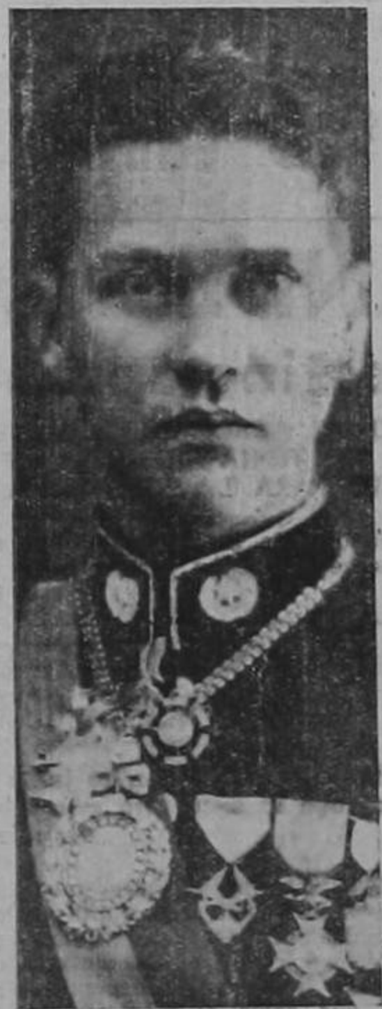
Teniente CORONEL BUCH Presidente de Bolivia